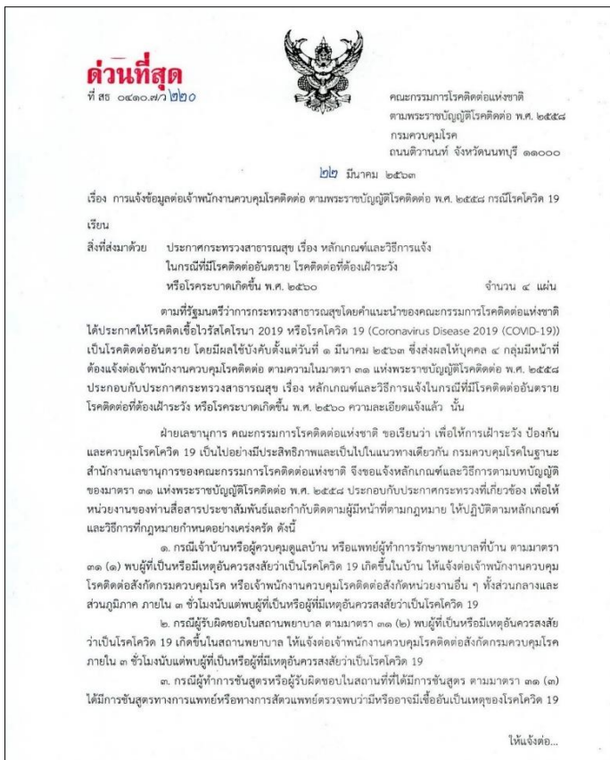
ภาพที่ 1 การแจ้งข้อมูลต่อเจ้าพนักงานควบคุมโรคติดต่อ ตาม พ.ร.บ.โรคติดต่อ พ.ศ.2558 กรณีโรคโควิด

การแจ้งข้อมูลต่อเจ้าพนักงานควบคุมโรคติดต่อ ตาม พ.ร.บ.โรคติดต่อ พ.ศ.2558 กรณีโรคโควิด 2019 ประกาศ ณ วันที่ 22 มีนาคม 2563 โดย คณะกรรมการโรคติดต่อแห่งชาติ (มาตรการและแนวทางการดำเนินการเพื่อการเฝ้าระวัง ป้องกัน และควบคุมโรคติดเชื้อไวรัสโคโรนา 2019 หรือโรคโควิด 19 (Coronavirus Disease 2019 (COVID-19)) ประกาศ ณ วันที่ 19 มีนาคม 2563, 2563) รายละเอียดในภาพที่ 1